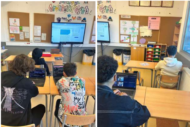
Fase 4: Documentació i avaluació.